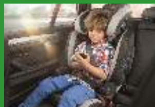
Автокресло группы II и III (для детей массой 15-36 кг)