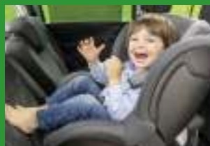
Автокресла групп I (для детей массой 9-18 кг)*