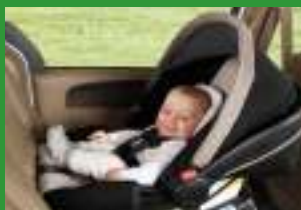
Автокресло группы 0+ (для детей массой < 13 кг)*