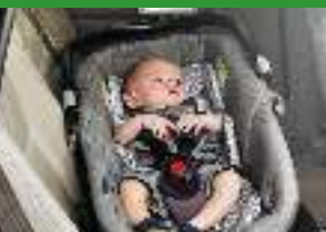
Автокресло «люлька» группы 0 (для детей массой < 10 кг)*

При покупке детского удерживающего устройства обязательно следует уточнить у продавца наличие сертификата на товар!